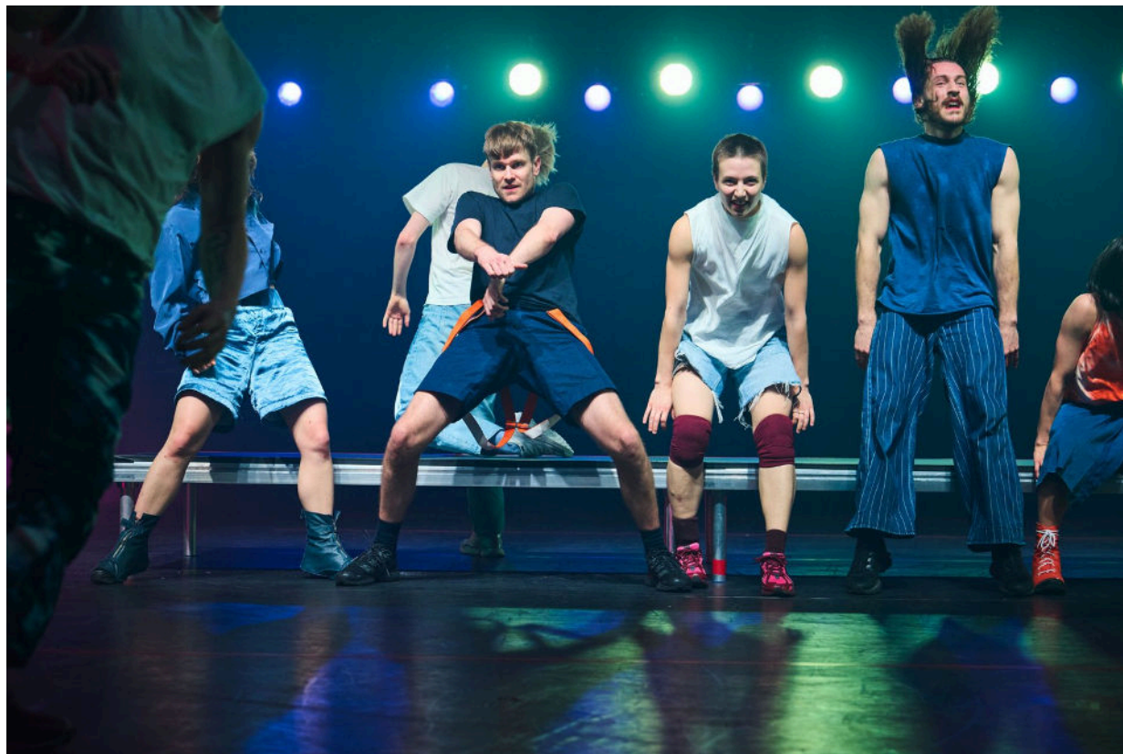
Bergensbaserte Carte Blanche, Norges nasjonale kompani for samtidsdans, er i Oslo med en fersk forestilling.

Carte Blanche danser så scenen nesten eksploderer i «How Romantic».