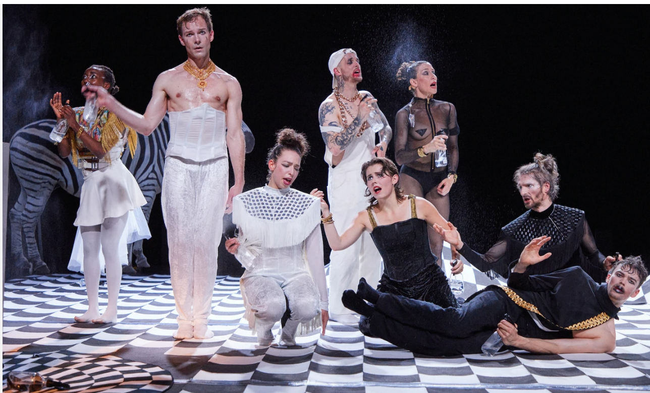
«Sovaco de Cobra» av Lander Patrick, danset av Carte Blanche på Dansens Hus. (Øystein Haara )

Det er mye bruk av tekst, tale og sang i dette verket, men det er dessverre ikke så enkelt å høre hva danserne sier og synger. Det ødelegger muligheten til å få et fullstendig inntrykk av hva «Sovaco de Cobra» prøver å fortelle. Men leken med sjakkens strenge regespill og stiliserte form for krig kombineres i alle fall med opprørstrang mot autoriteter og slavedrivere på en måte som det etter hvert blir noe lettere å se. Da danserne til slutt henger en kronet gipsbyste av en mannsfigur (altså en konge) i løkken som har hengt og ventet hele forestillingen og synger om å fange «the big fish», er det i alle fall åpenbart at dette verket gjerne har noe det skulle sagt til ymse autoritære ledere. Det hele avsluttes med en parade av bilder av virkelige presidenter og diktatorer (Putin inkludert) som også er «big fish». Ingen tvil om politisk ståsted, i alle fall.