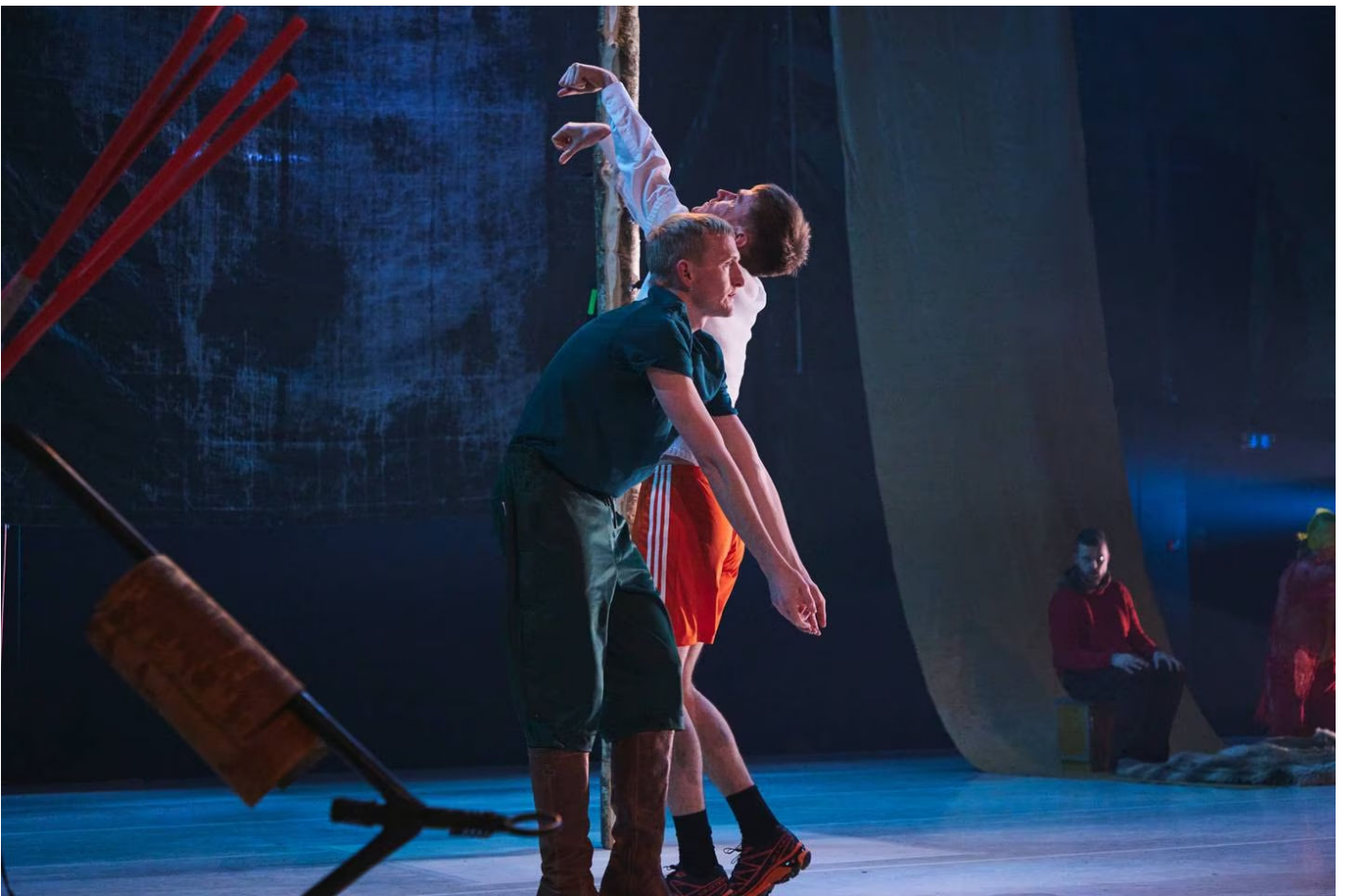
Fra Carte Blanches nye forestilling «Birget; ways to deal, ways to heal», som spilles i Operaen i Oslo.

Som visuell opplevelse er «Birget ...» full av ulike fokuspunkter fra start til slutt. Her skjer det mye i alle deler av det relativt store scenerommet på Scene 2. Mye av det som skjer, er relatert til ulike gjenstander dansekompaniet har tatt med seg fra Gouvdayaidnu/Kautokeino. Dit dro de som en del av arbeidet med forestillingen. Slik har forestillingen fått en ganske tydelig geografisk forankring. En slede er et slikt tydelig visuelt element, og etter hvert blir også store, gule plastsekker fra Felleskjøpet (sikkert en del av reindriftsvirksomheten) en viktig del av forestillingen. Til tider blir det mye å fokusere på, med tanke at vi i tillegg omtrent hele veien hører norske politikere prate på sin sedvanlige kronglete måte. Men dette er uansett ganske vitalt.