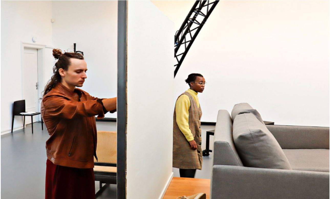
De få publikummerne blir plassert i godstoler og kjøres inn i installasjonen.