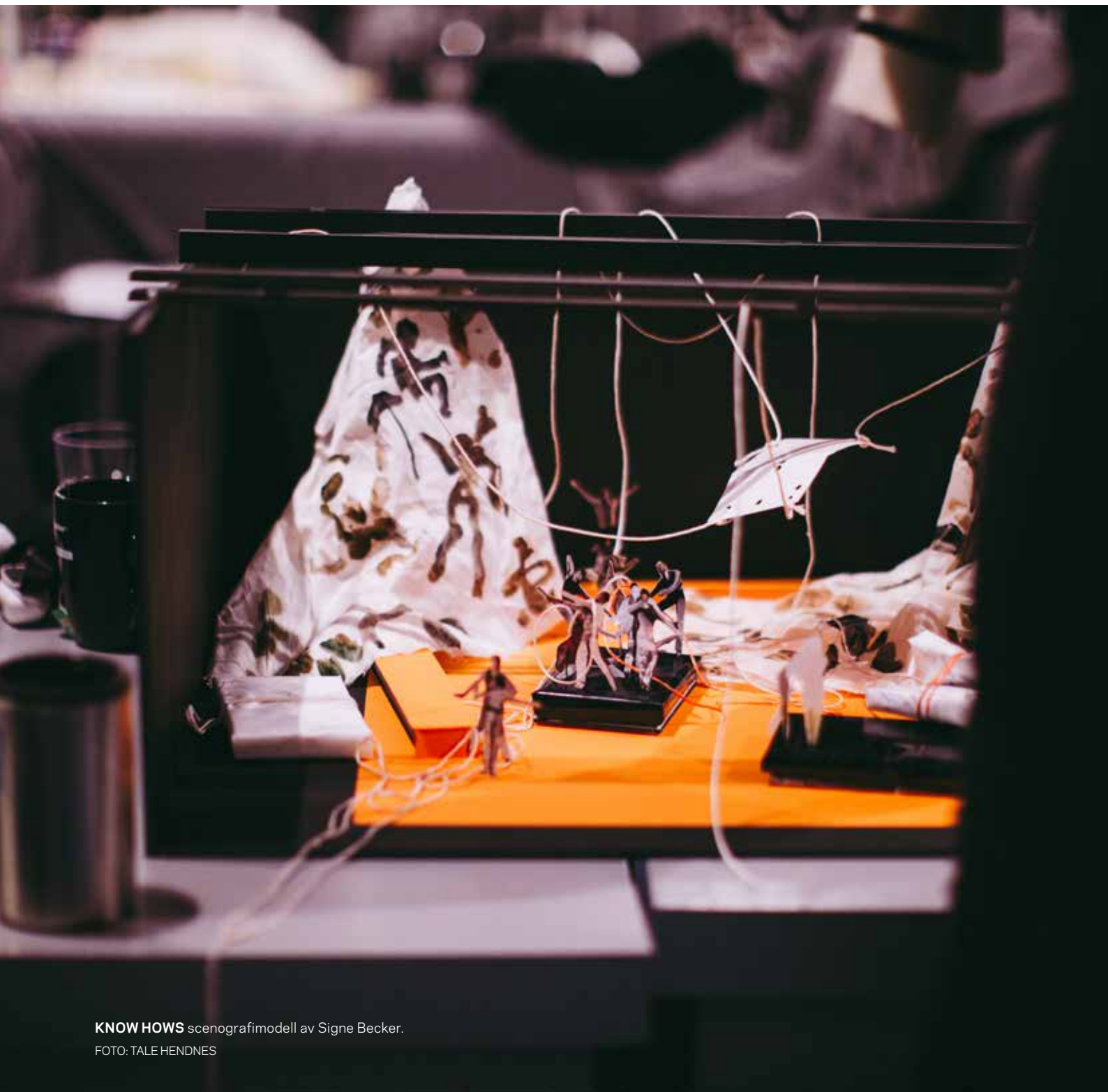
KNOW HOWS scenografimodell av Signe Becker.